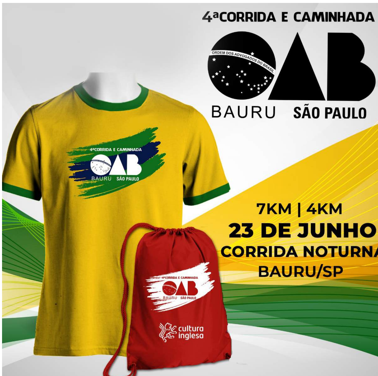
Com realização da OAB Bauru e organização da Life Sports, a corrida conta com o apoio da: Mandaliti Advogados, JBM Advogados, Honda Lago-San, Cultura Inglesa, APM, MaiKai, Palamin Impressão Digital, Unimed Bauru e Prefeitura de Bauru.

É importante ter preparo físico para participar das corridas, principalmente as de fundo como as oferecidas pelo evento. Entretanto para a caminhada, a ida apenas com uma roupa confortável e tênis apropriado, já estará seguindo o re-