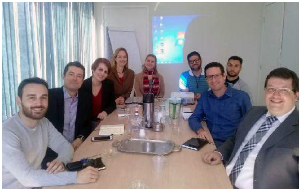
No último dia 07, a Comissão de Direito Eletrônico e Digital da OAB Bauru participou de encontro da Comissão Permanente de Inovação e Tecnologia para preparação de audiência pública sobre lei municipal

Álbum de fotos - divulgação no site e na página da OAB Bauru.